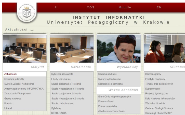
Rysunek 1 Przykładowy rysunek

Witryna Instytutu Informatyki została przedstawiona na Rysunku 1 (nie stosujemy sformułowań poniżej, powyżej, na następnej stronie ).