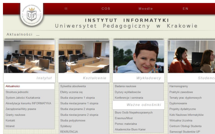
Rysunek 1 Przykładowy rysunek

Witryna Instytutu Informatyki została przedstawiona na Rysunku 1 (nie stosujemy sformułowań poniżej, powyżej, na następnej stronie ).